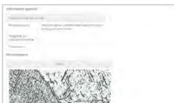
Tabelle di riferimenti incrociati con oltre 10 milioni di records in materiali equivalenti utilizzando una classificazione proprietaria delle similarità suddivisa in 5 categorie. Inoltre, l'algoritmo brevettato SmartCross 2 permette l'identificazione di materiali equivalenti sconosciuti sulla base di similarità chimica o meccanica o loro combinazione.